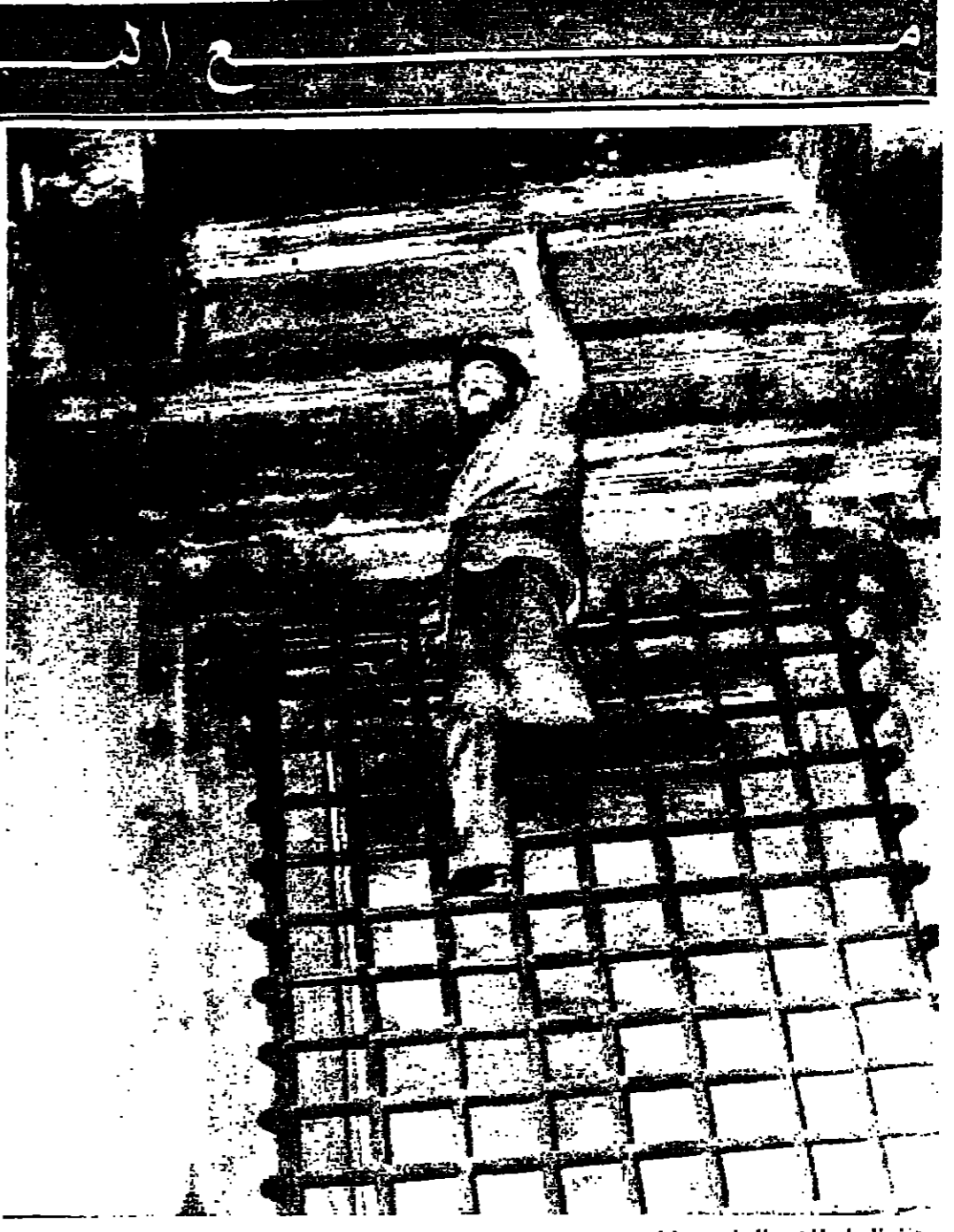
خدا الرجز البثور المساق يحاول اصنح الشفق الذي فوق راسه اتسه حنوز الوصول الى غرفة رئيس وزراء... اشطاسا السنبور «الدو مور»...